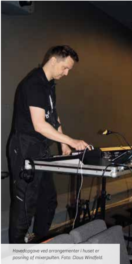
Hovedopgave ved arrangementer i huset er posning af mixerpulten.

og foretager interviewet, ser Kevin på en skraldespand, som er raseret af enten nogle rødder eller mere sandsynligt af en fugl, forklarer Kevin, at dér er en opgave til ham og kollegerne.