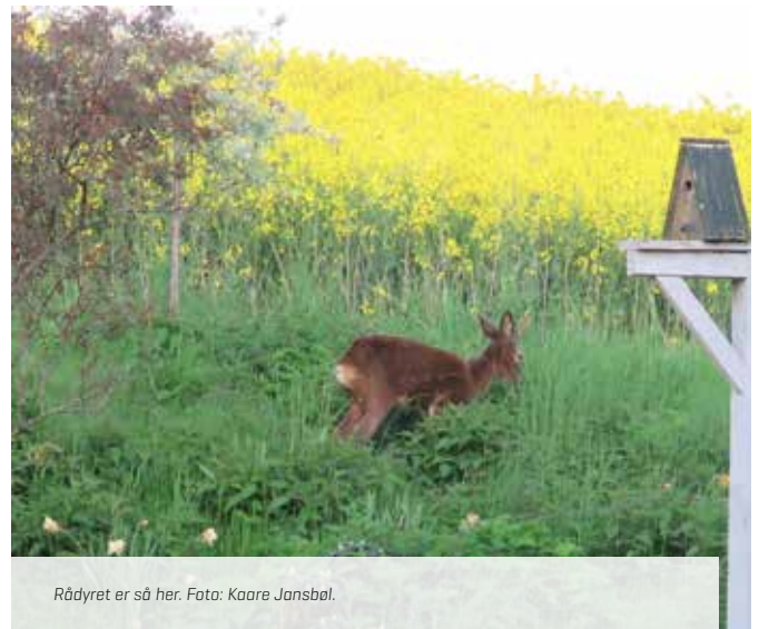
Rådyret er så her.