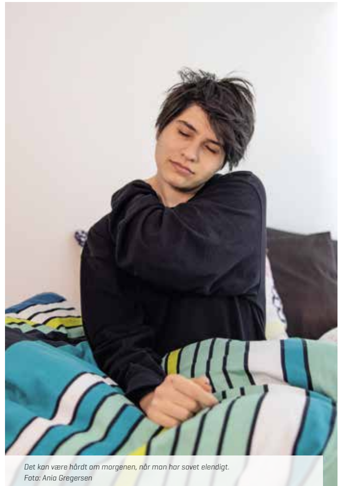
Det kan være hårdt om morgenen, når man har sovet elendigt.

Der er desuden en del af vores kollegaer, som rammes af stress i større eller mindre grad. I disse situationer