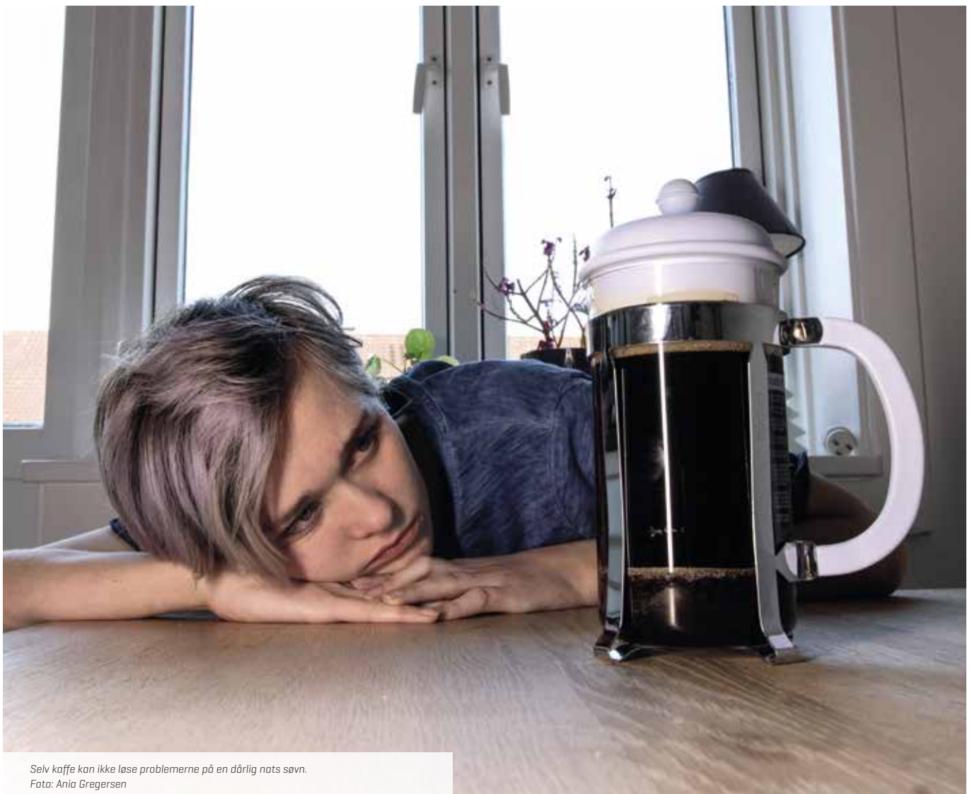
Selv kaffe kan ikke løse problemerne på en dårlig nats søvn.

Vi kan oplyse, at søvn blive ret af de vigtige temaer på den kommende Midtvejskonference for tillidsrepræsentanterne. •