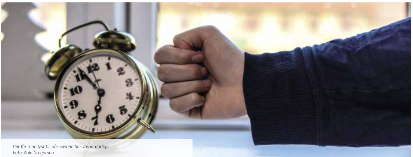
Det får man lyst til, når søvnen har været dårligt.