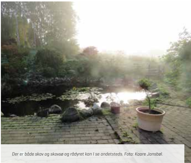
Der er både skov og skovsø og rådyret kan I se andetsteds.